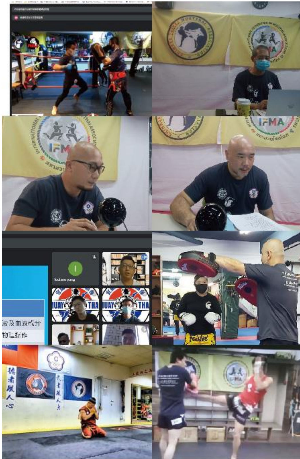
(簡述講習過程並附講習現場照片)