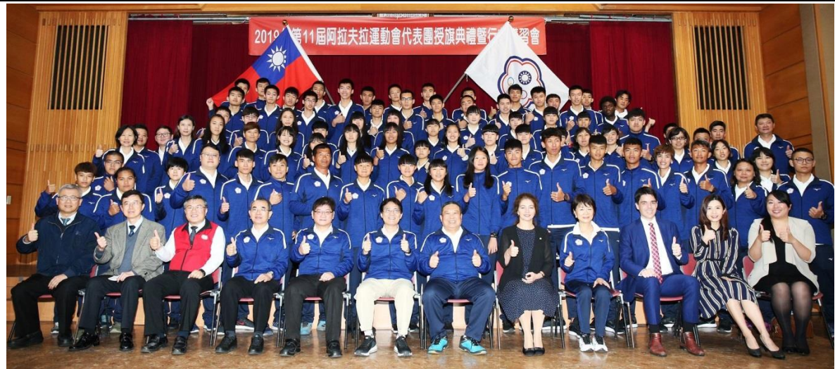
2019 阿拉夫拉 Arafura 運動會中華奧會代表隊大陣容