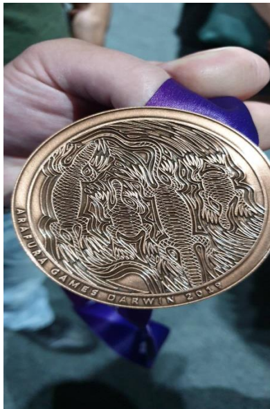
阿拉夫拉 Arafura 運動會獎牌正面