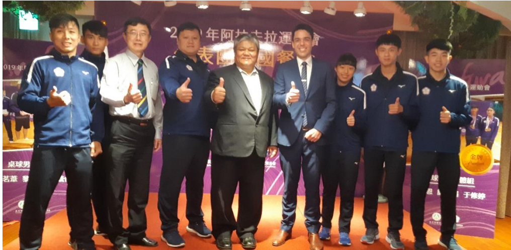
我會與澳洲大使合影