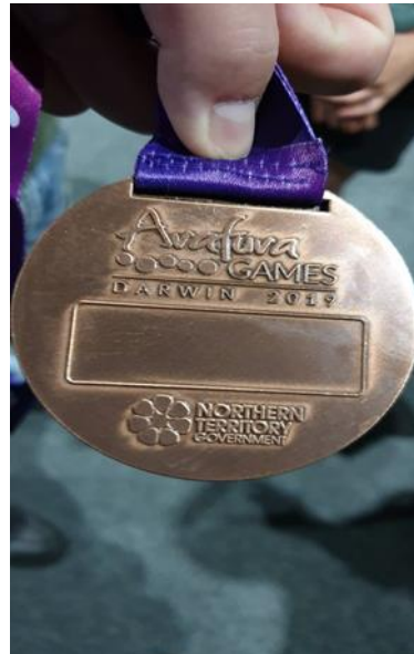
阿拉夫拉 Arafura 運動會獎牌背面