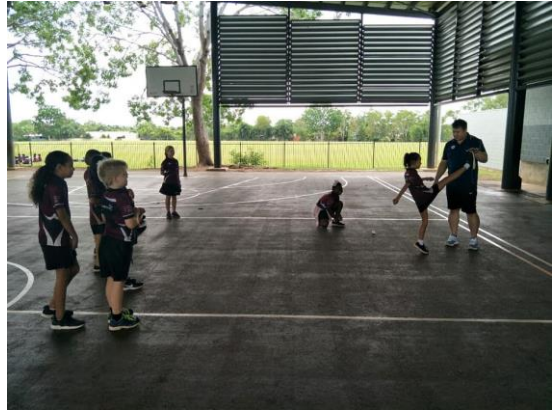
我全体隊職員指導達爾文學校泰拳